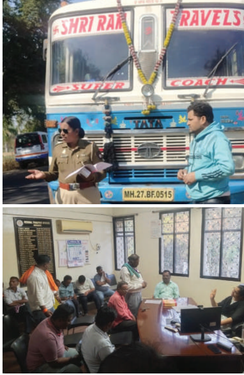
प्रादेशिक परिवहन अधिकाऱ्यांशी चर्चा करताना बजरंग दुर्स अँड टॅक्लस कंपनीचे कर्मचारी.

परतवाडा, (दि.8) - आपल्या दि.3 जानेवारीच्या अंकात 'द.महासागर' ने परतवाडा येथून धावणाऱ्या अनधिकृत खाजगी बसेस चा भंडाफोड केला. या बातमीनंतर जागी झालेल्या प्रादेशिक परिवहन विभाग(आरटीओ) च्या अधिकाऱ्यांनी अश्या बस वर कारवाई सुरु केली. मात्र ही कारवाई पुढे पाठ, मागे सपाट अशी होत आहे. कारवाईनंतरही या बसेस राजरोसपणे धावत आहे. प्रादेशिक परिवहन विभागामार्फत नागपूर ते खंडवा, अमरावती ते खंडवा, अमरावती ते बैतुल या मार्गांनी मध्यप्रदेशात जाणाऱ्या खाजगी बसेस ची तपासणी करण्यात आली. अमरावती ते परतवाडा या मार्गावर 59 च्या वर टॅक्लस बसेसची तपासणी करण्यात आली. यामध्ये आता पर्यंत 25 दोषी टॅक्लस आडवून आल्या. त्यांच्यावर मोटार वाहन कायद्याच्या विविध कलमांमध्ये दंडात्मक कारवाई करून प्रती टॅक्लस 10 हजार असा आतापर्यंत 1 लाख 67 हजार 765 रुपये दंड ठोकण्यात आला. यापैकी 62,475 रुपयाची दंडात्मक वसुली करण्यात आली. ही मोहीम 2 जानेवारीपासून राबविण्यात येत आहे. मात्र वास्तवात ही कारवाई निष्क्रिय ठरत आहे. दिवसभरात एका बस ला 10 हजाराचा दंड ठोठावला की, पुढेच 24 तास त्या बसला दंड ठोठावता येत नाही. या वेळेत ही बस राजरोसपणे प्रवासी वाहतूक करत, पुन्हा दुसऱ्या दिवशी रस्त्यावर उतरत आहे. त्यामुळे आरटीओची कारवाई 'पुढे पाठ, मागे सपाट' असल्याचे दिसत आहे.