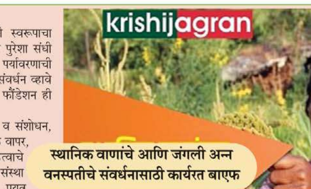
स्थानिक वाणांचे आणि जंगली अन्न वनस्पतीचे संवर्धनासाठी कार्यरत बाएफ

ग्रामीण दुर्बल कुटुंबांचा स्थायी स्वरूपाचा विकास व्हावा, त्यांना रोजगाराच्या पुरेशा संधी उपलब्ध व्हाव्यात या बरोबरच पर्यावरणाची समृद्धी होऊन सामाजिक मुल्यांचे संवर्धन व्हावे यासाठी बाएफ डेव्हलपमेंट रिसर्च फौंडेशन ही संस्था कार्यरत आहे. विकासासाठी तंत्रज्ञानाचा वापर व संशोधन, नैसर्गिक संसाधनांचा परिणामकारक वापर, महिलांना विकास प्रक्रीयेत महत्त्वाचे स्थान देणे या गोष्टी अनुसरून संस्था आपले उद्दिष्ट साध्य करण्याचा प्रयत्न करते. ग्रामीण दुर्बल कुटुंबांचा स्थायी स्वरूपाचा विकास व्हावा, त्यांना रोजगाराच्या पुरेशा संधी उपलब्ध व्हाव्यात या बरोबरच पर्यावरणाची समृद्धी होऊन सामाजिक मुल्यांचे संवर्धन व्हावे यासाठी बाएफ डेव्हलपमेंट रिसर्च फौंडेशन ही संस्था कार्यरत आहे. संस्था १९६७ मध्ये स्थापन झालेली आहे. गो-पैदास, शेती-वृक्ष-फळझाडे, पाणलोट क्षेत्रविकास, वनीकरण, महिला विकास, सामूहिक आरोग्य व आश्रम शाळांमध्ये जागृती अशा कार्यक्रमांच्या माध्यमांतून संस्था आज १२ राज्यांमध्ये कार्यरत आहे. बियाणे हा शेतीचा आत्मा आणि सर्वात महत्त्वाची निविड असून गेल्या हजारो पिढ्यांपासून शेतकऱ्यांनी विविध पिकांच्या अनेक जाती निवडल्या, सुधारणा केल्या आणि त्याचा अन्न आणि पोषण सूरक्षा, आर्थिक उन्नती साठी वापर केला. परंतु सध्या सुरु असलेल्या एकांगी पद्धतीच्या पिक वाण सुधारणा कार्यक्रमांमुळे अनेक पिक जातीमधील विविधता