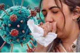
एचएमपीव्ही विषाणूचा तिसरा रुग्ण आढळून आला.

महासागर प्रतिनिधी, मुंबई, दि. ८ : महाराष्ट्रात बुधवारी कोरोना सशस्त्र एचएमपीव्ही विषाणूचा तिसरा रुग्ण आढळून आला. मुंबई येथील हिरानंदानी रुग्णालयात ६ महिन्यांच्या मुलीला संसर्ग झाल्याचे आढळून आले. मुलीला १ जानेवारी रोजी गंभीर खोकला, छातीत जडपणा आणि ऑक्सिजनची पातळी ८४% पर्यंत घसरल्याने रुग्णालयात दाखल करण्यात आले होते. तथापि, चिमुकली आता बरी झाली आहे. देशातील एकूण रुग्णांची संख्या ९ वर पोहोचली आहे.