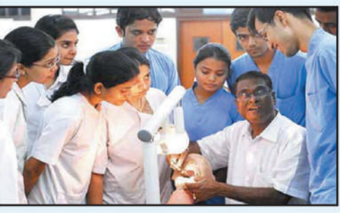
कोण होणार ?

आ रोम्य क्षेत्रात करीअर करण्यासाठी फक्त डॉक्टर हा एकमेव पर्याय नाही. हे क्षेत्र खूप मोठं आहे. इथे तुम्ही विविध प्रकारे काम करू शकता. व्यवस्थापन क्षेत्रात रस असेल तर हॉस्पिटल मॅनेजमेंट म्हणजे रुग्णालय व्यवस्थापनाकडे तुम्ही वळू शकता. हेल्थकेअर क्षेत्राची वाढ वेगाने होते आहे. त्यातच परदेशी कं पन्यांनीही या क्षेत्रात मोठी गुंतवणूक केल्याने रोजगाराच्या नव्या संधी निर्माण होत आहेत. म्हणूनच तुम्ही हॉस्पिटल मॅनेजमेंटचा अभ्यासक्रम पूर्ण करून पुढे जाऊ शकता. हॉस्पिटल मॅनेजमेंटमध्ये डिप्लोमापासून पोस्ट ग्रॅज्युएशनपर्यंतचे अभ्यासक्रम उपलब्ध आहेत. काही कॉलेजेसमध्ये या अभ्यासक्रमांच्या प्रवेशासाठी प्रवेश परीक्षेचं आयोजन केलं जातं. हॉस्पिटल मॅनेजमेंटसंबंधीच्या या अभ्यासक्रमांमध्ये कायदा, फायनान्स, ह्युमन रिसोर्स, ऑपरेशन्स मॅनेजमेंट, वैद्यकीय तसंच कायदाविषयक प्रश्न असे