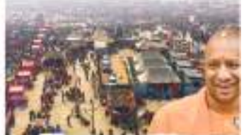
पुणेची महाकुंभ घेऊन येऊन ५०० कोटी रुपये आहे. मंत्र सरकारने महाकुंभसाठी २०० कोटी रुपये दिले आहेत.