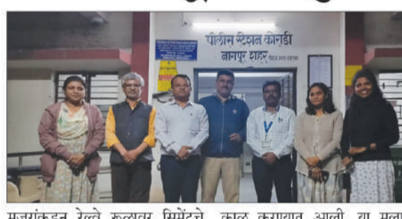
मजूरांकडून रेल्वे रूळवर सिमेंटचे स्लीपर उचलण्याचे अवजड काम करवून घेण्यात येत असल्याचे आढळून आले. सदर काम धोकादायक उद्योगात येत असल्याने कंत्राटदाराविरुद्ध कोराडी पोलिस ठाण्यात भारतीय न्याय संहिता २०२२, कलम १४६, अल्पवयीन न्याय (मुलांची काळजी व संरक्षण) कायदा २०१५, कलम ७५, ७९ नुसार गुन्हा दाखल करण्यात आला. सोबतच किशोरवयीन कामगारांची मुक्तता करण्यात आली. कंत्राटदारांने हे मजूर मध्यप्रदेशातील बैतुल जिल्ह्यातून आणले होते. गाड्यांच्या दुरुस्ती दुकानात काम करणाऱ्या एका मुलाची सुटकाही