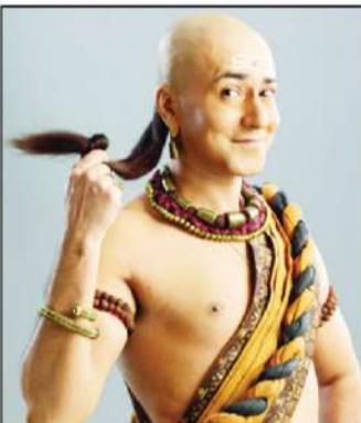
मी जास्त सांगू शकणार नाही, पण हे नक्की की तेनाली रामाच्या बुद्धीचातुर्याची आता खरी कसोटी होणार आहे. संकट मोठे आहे आणि व्यक्तिगत आव्हाने आहेत. प्रेक्षकांना काही हृदयस्पर्शी क्षण, हुशारीने शोधलेले उपाय आणि काही अनपेक्षित ट्विस्ट बघायला मिळतील. ही व्यक्तिरेखा आणि कथानकातील हा महत्त्वाचा टप्पा आहे.

आयत्या वेळी आम्ही काही संवाद उत्स्फूर्तपणे टाकतो आणि बऱ्याचदा असे उत्स्फूर्त क्षण प्रेक्षकांच्या विशेष पसंतीस उतरतात. ७. सेटवर तुला कोणासोबत काम करताना सगळ्यात जास्त मजा येते आणि का? एकाच व्यक्तीची निवड करणे अवघड आहे, कारण सर्वच कलाकार जणू एका कुटुंबाचा भाग आहेत. पण एकच नाव घ्यायचे झाले तर मी पंकज बेरी यांचे नाव घेईन. सेटवरील त्यांची ऊर्जा सगळ्यांना चेतवणारी असते. मधल्या विश्रांतीत आमच्यात खूप हास्य-विनोद होत असतात. वातावरण हलकेफुलके ठेवणारी माणसे आसपास असली की वातावरण प्रफुल्लित राहते; विशेषतः ज्या दिवसांमध्ये दीर्घ काळ शूटिंग चालते, तेव्हा! ८. तुझ्या व्यक्तिरेखेचा पुढचा प्रवास कसा असणार आहे याची कल्पना देशील का? आगामी भागात कथानक कसे वळण घेणार आहे?