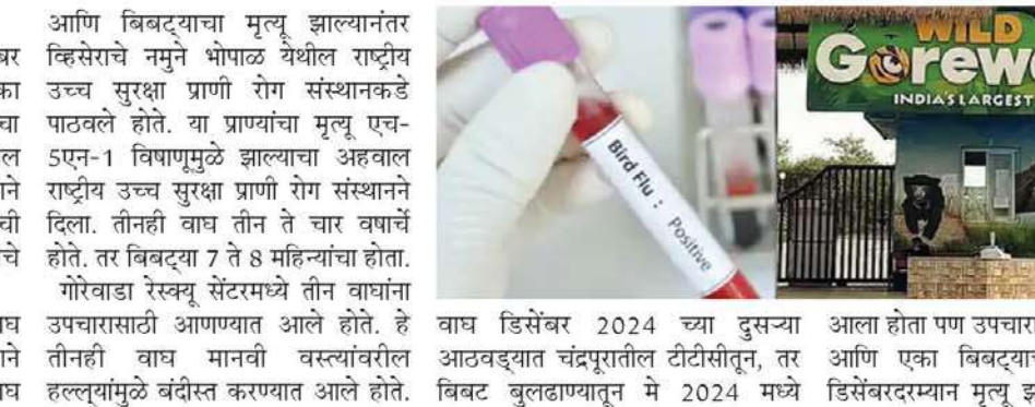
वाघ डिसेंबर 2024 च्या दुसऱ्या आठवड्यात चंद्रपूरतील टीटीसीतून, तर बिबट बुलढाण्यातून मे 2024 मध्ये आला होता पण उपचारादरम्यान तीन वाघ आणि एका बिबट्याचा 20 ते 23 डिसेंबरदरम्यान मृत्यू झाला. वाघ आणि

महासागर प्रतिनिधी, नागपूर, दि. ९ : गोरेवाडा रेस्क्यू सेंटरमध्ये डिसेंबर महिन्यात तीन वाघ आणि एका बिबट्याचा मृत्यू झाला होता. या प्राण्यांचा मृत्यू बर्ड फ्लू मुळे झाल्याचा अहवाल प्राप्त झाला होता. चिकन खाल्ल्याने वाघांना झाला बर्ड फ्लू झाल्याची प्राथमिक माहिती असल्याचे राज्याचे वनमंत्री गणेश नाईक यांनी सांगितले.