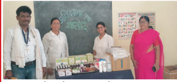
आरोग्य सेवक सह आरोग्य पथक

दुषीत पाण्याने बिघडली होती ग्रामस्थांची प्रकृती | प्रशासन सतर्क, आरोग्य पथक 24 तास गावात