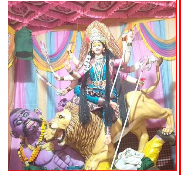
जय शिवाजी नवदुर्गा चर्डीका चौक हिवरखेड