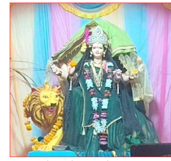
मोठा महादेव सस्थान पेठपुरा